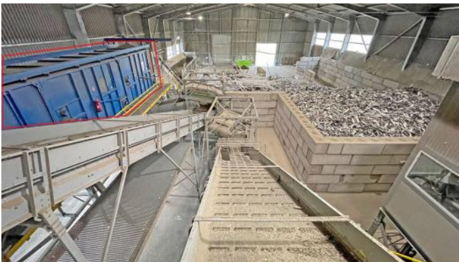
Hartner 3-deck ballistic separator