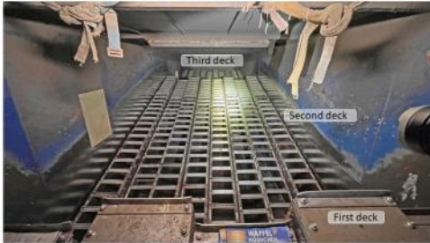
Hartner 3-deck ballistic separator