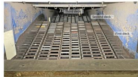
Hartner 3-deck ballistic separator