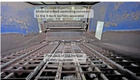
Hartner 3-deck ballistic separator

The mixed paper with cardboard content is sorted by size via the elliptically oscillating screen boxes. Large, flat and stiff materials such as cardboard are conveyed to the screen overflow to bunker belt 1. The smaller deinking paper fraction falls through the screen openings onto a discharge conveyor belt and can be further sorted.